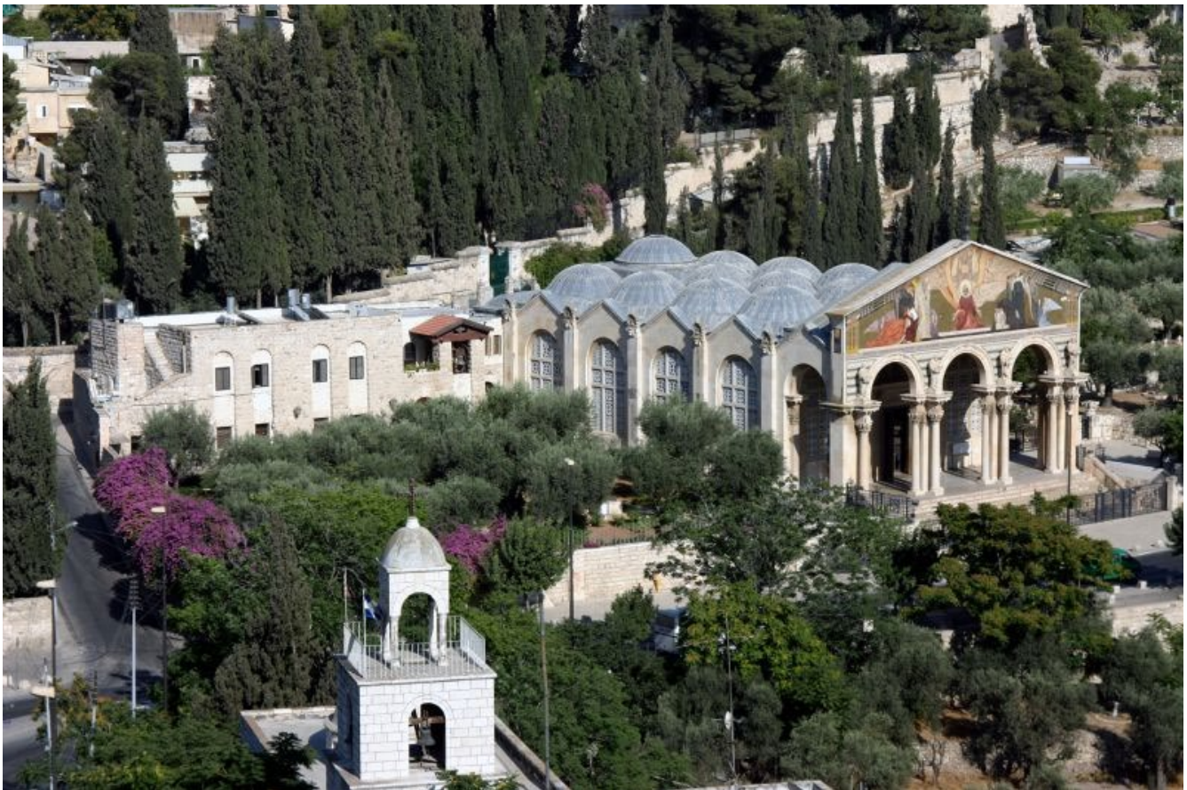
La Iglesia de Todas las Naciones se encuentra en la base del Monte de los Olivos, adyacente al Jardín del Getsemaní. Conmemora el sitio tradicional de la agonía de Jesús antes de su arresto

El Sermón del Monte está lleno de lo que llamamos “señales de los tiempos” que apuntan al regreso del Señor. Algunos argumentan que estas señales estarán confinadas a la Tribulación y serán proporcionadas para el beneficio de aquellos que vivan durante la Tribulación. En otras palabras, las señales no tienen ninguna relevancia para la Iglesia existente en la tierra antes de la Tribulación.