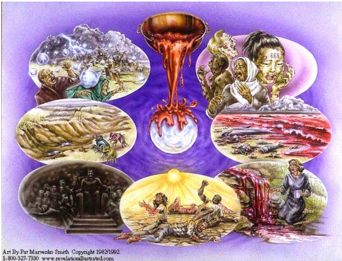
“Las Plagas de las Siete Copas”, por Pat Marvenko Smith ( www.revelationillustrated.com )

Considere nuevamente el versículo 21: “ porque habrá entonces gran tribulación, cual no la ha habido desde el principio del mundo hasta ahora, ni la habrá ”. ¿Quiso decir Jesús lo que dijo o no? Seguramente este no es un caso de hipérbole – de exageración para hacer un punto. Todo en el pasaje grita que debemos tomar las palabras de Jesús literalmente.