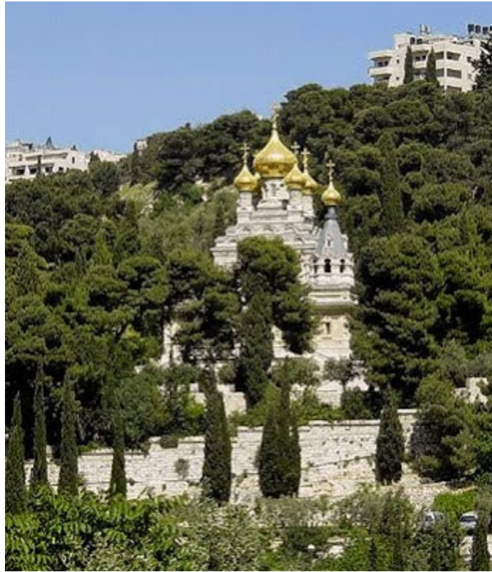
La Iglesia Ortodoxa Rusa de María Magdalena, ubicada en la ladera occidental del Monte de los Olivos.

El punto de vista mayoritario de la cristiandad, católica y protestante, es el enfoque Amilenial. Este enfoque espiritualiza la profecía bíblica y concluye que no habrá ninguna Tribulación o Milenio futuros. Los amilenialistas argumentan, en cambio, que estamos experimentando simultáneamente la Tribulación y el Milenio ahora mismo y lo hemos estado haciendo así desde la Cruz. Estamos supuestamente en el Milenio porque el Espíritu Santo está restringiendo el mal por medio de la Iglesia. Y estamos simultáneamente en la Tribulación debido a que la Iglesia está sufriendo persecución.