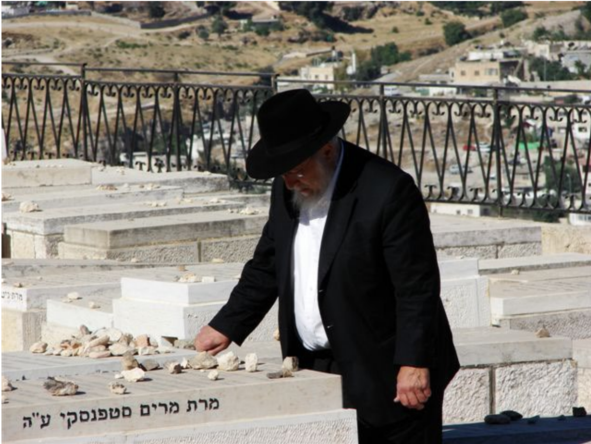
Un judío ortodoxo hace una pausa para rendir homenaje en una tumba en el Monte de los Olivos. La forma apropiada de hacer esto es dejar una "piedra del recuerdo" en la parte superior de la tumba (Foto cortesía del Dr. David Reagan).

Pero yo discrepo respetuosamente con esa posición. Creo que Jesús menciona el Rapto en los versos 36-44 de Mateo 24. La primera razón por la que veo el Rapto en estos versos es porque Jesús dice, "Pero del día y la hora nadie sabe" . ¿Cómo podría estar refiriéndose probablemente a Su Segunda Venida? Tenga en cuenta que Él le acababa de decir a Sus discípulos cuándo exactamente iba a regresar – "inmediatamente después de la Tribulación de esos días" (Mateo 24:29).