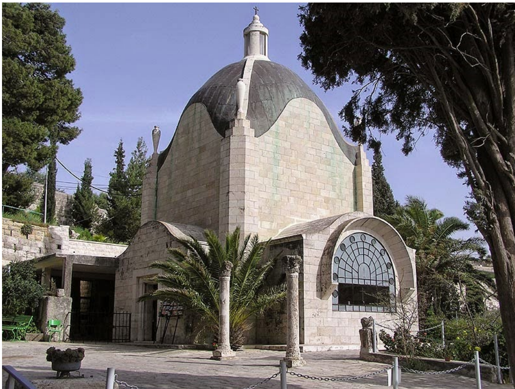
La Capilla Dominus Flevit está ubicada en la ladera occidental del Monte de los Olivos, cerca de la cima. El nombre significa, "El Señor Lloró" y por eso la iglesia fue diseñada por su arquitecto para que pareciera una lágrima. Se asienta en el sitio tradicional donde Jesús lloró por la ciudad de Jerusalén.

Josefo dice que los romanos mataron un millón de judíos en el asedio de Jerusalén del 70 EC. Los historiadores están convencidos que este número es muy exagerado. Pero incluso si es cierto, no es nada comparado a los seis millones de judíos que perecieron a manos de los nazis.