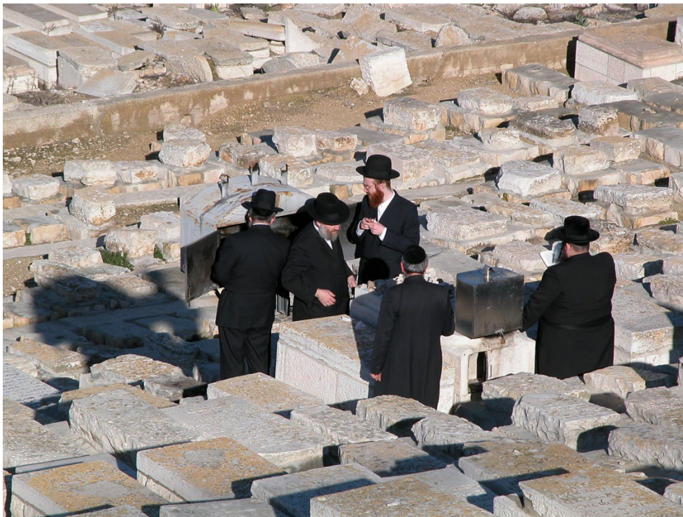
Judíos ortodoxos ocupándose de una tumba en el Monte de los Olivos (Foto cortesía del Dr. David Reagan).

Hace más de cuatrocientos años, los Puritanos se apropiaron de este pasaje y argumentaron que un día Israel sería restablecido y que cuando eso pasara, la generación que fuera testigo de ello sería la generación que experimentará el regreso del Señor.